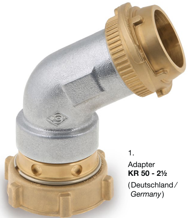
1. Adapter KR 50 - 2½ (Deutschland/ Germany)

With the adapter KR 50-2½ (VK 50 / 60° alu elbow / 2½" BSP female nut) we offer a simple and operationally solution, e.g. for the German market, see picture 1. For Switzerland, we offer a version with 2¾" female nut, see picture 2.