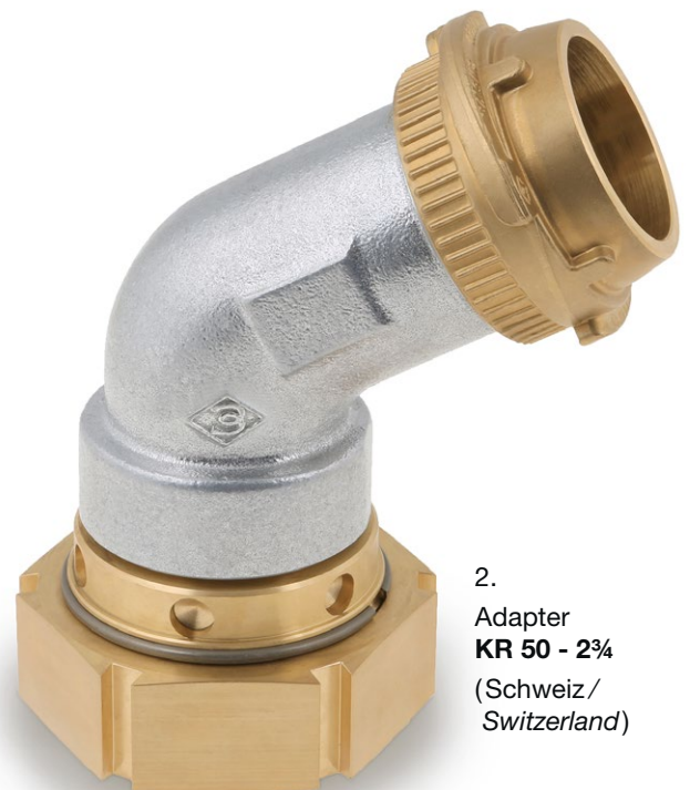
2. Adapter KR 50 - 2¾ (Schweiz/ Switzerland)