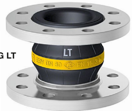
Type ERV-G LT

GELBRING LT -Gummikompensatoren in besonders kältefester Ausführung für normgerechte Mineralölprodukte, z.B. Diesel, Heizöl bis +90 °C, Flugkraftstoffe, Petroleum bis +60 °C, Otto-Kraftstoffe bis +40 °C. Temperaturbereich (medienabhängig) -40 °C bis +90 °C, kurzzeitig bis +100 °C. Elektrisch ableitfähig. Innen : NBR (Nitril), nahtlos, abriebfest Druckträger : PA-Textilcord Außen : Chloropren CR Kennzeichnung : Gelber Ring mit weißem 'LT'-Aufdruck, ERV DN ..., PN 16, Herstellungsdatum Flansche 1) : Drehbar, DIN PN 10/16, Stahl, verzinkt